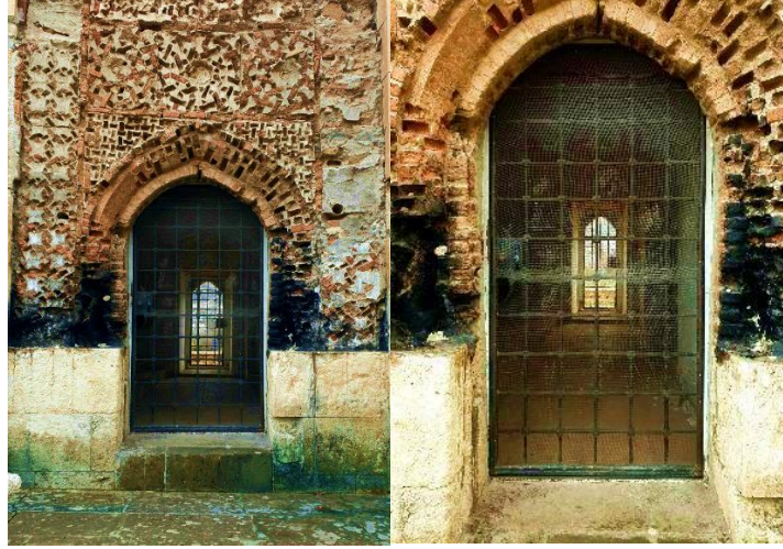
Görsel 3. A/r/tograf Şeyma'nın sorgulama süreci

A/r/tografların görsel günlükleri için çektikleri fotoğraflar üzerinden alınan cevaplarda fotoğraf çekerken geçmiş yaşamın da çekilen fotoğrafların içinde barındığını dile getirmişlerdir.