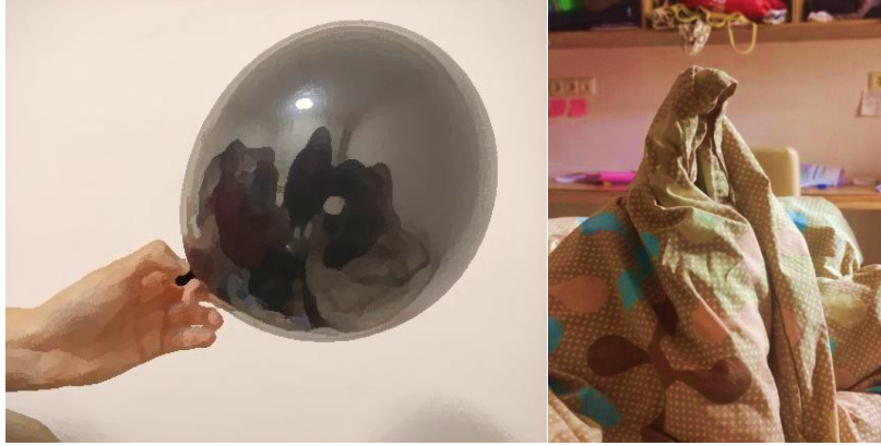
Görsel 5. A/r/tograf Kader'in sorgulama süreci

Bu kategoride a/r/tograflar, özgürlük isteklerinden, yaşamlarındaki korkularından, ürettikleri sanatsal çalışmalarının bozulacak olmasından, kendilerini diğer insanlardan farklı görmelerinden bahsetmişlerdir. Ayrıca, kendilerini sanat bölümünde okuduklarından dolayı özel hissetmeleri ve bunun sonucunda benmerkezciliğin oluşumu, geçmişin yüklediği özgüvensizlikleri bu kategoride incelenmiştir.