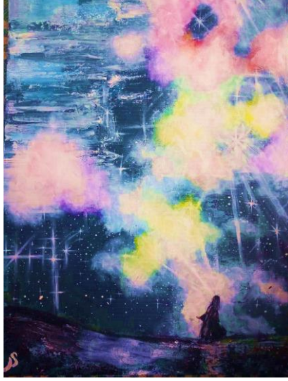
Görsel 15. A/r/tograf Sema'nın özgün eseri

Metafor kullanarak yaptığı çalışmasında Sema: