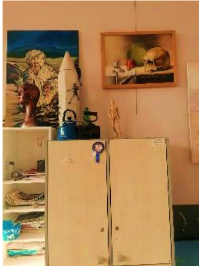
Görsel 12. A/r/tograf Gül'ün sorgulama süreci

Estetik duyarlılığın a/r/tografların üzerindeki etkisi olumlu ve olumsuz olmanın yanı sıra zaman içerisinde uyum, sanatsal bakış gibi alanlara da yayıldığı söylenebilir.