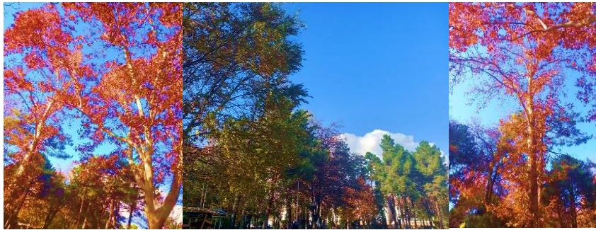
Görsel 4. A/r/tograf Sema'nın sorgulama süreci

Söyleminden yola çıkarak a/r/tograf, geçmiş yaşam deneyimlerini yok sayamayacağını ancak onunla yaşamayı öğrendiğini aktarmıştır.