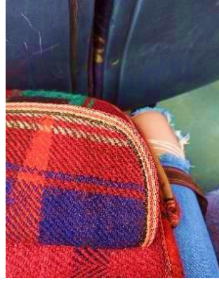
Görsel 2. Araştırmacı Sorgulama Süreci – Etnik Köken Sorgulamaları

Herkesin bir etnik kökeni vardır. İstmeden de olsa bunlar insan hayatına yansımaktadır. Örneğin Diyarbakırlı bir arkadaşımın doğum günümde hasır bir çanta hediye etmiş olması bu durumu açıklar niteliktedir. Bu basit gibi görünen detay otobüsteyken neden ilgimi çekmişti? Bir şeyler çekiyordum ama nedenini bilmeden. İşte benim merakımda tam bu noktada başlamaktaydı. Sanat ve sanat eğitimi yetiştiren kurumlarda bu yansımalar nasıl olmaktadır? Sanat ne şekilde onlara yansımaktadır? Bu sorular çerçevesinde araştırmamı yürüteceğim çalışma grubunu belirlemem gerekiyordu. Çalışma grubum kolay ulaşılabilir örneklem yöntemi ile belirlenmiş olup ana sanat atölye dersi alan 2.sınıf öğrencilerinden oluşmaktadır.