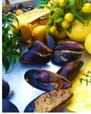
Görsel 11. A/r/tograf Hülya'nın sorgulama süreci

A/r/tografların görsel günlüklerinde “neden bu fotoğraf?” sorusu yöneltildiğinde öğrencilerden genel olarak “ estetik geldi ” cevabı alınmıştır. A/r/tograflarla yapılan görüşmelerde “Estetik kaygınız var mı? Var ise sanatsal işlerinize ve günlük yaşantınıza nasıl yansıyor?” sorusu yöneltilmiştir. Aldıkları sanat eğitiminin kaygı yansımaları olarak a/r/tograflardan Sema, “ Estetik kaygı beni çok yoruyor ” (G2, 05.12.2022) derken bir diğer öğrenci “ Lisans eğitimi beni daha çok estetiğe dikkat etmeme yol açtı ve hatta tabak seçiminde bile buna dikkat ediyorum ” (G2, 05.12.2022) ifadesinde bulunarak bu kaygının estetik uyum kaygısına dönüştüğünü ifade etmiştir. Bir diğer öğrenci ise “ Estetik kaygım çok yüksek ve bundan dolayı yetersizlik hissine kapılıyorum ” (G2, 05.12.2022) ifadelerinde bulunmuştur.