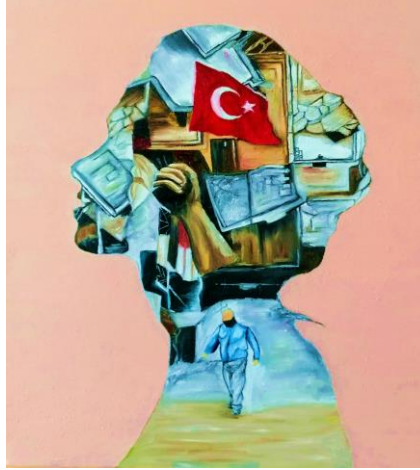
Görsel 14. A/r/tograf Gül'ün özgün eseri

A/r/tografılardan bulmuş oldukları metaforlardan yola çıkarak özgün eserler üretmeleri istenmiştir. Yapılan çalışmalarda araştırmacı gözlemleri ile ilk haftadan son haftaya neler değiştiği gözlemlenmeye devam edilmiş, öğrencilerin metafor seçimlerinde, günlük yaşamları ve sanatsal faaliyetlerinin birbirlerini etkiledikleri görülmüştür.