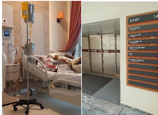
Görsel 1. Araştırmacı Sorgulama Süreci – Hastanede A/r/tografik Sorgulama

Almış olduğum a/r/tografik dersinde haftalarca çektiğim fotoğrafların sorgulamasının bir sonucu olarak araştırma konum ortaya çıkmıştır. İlk fotoğraflarda çekmiş olduğum ortam bir hastane ortamıdır. Birbirinden farklı insanlar ile tanışma fırsatını bulduğum bir süreç geçirdim. İnsanlar okudukları bölümlere, buldukları kültüre, hatta hastalıklarına göre farklılıklar gösteriyordu (Görsel 1). Özümüzde hepimiz insandık ama birçok farklılıklarımız vardı. Biz kimdik ve ne için vardık?