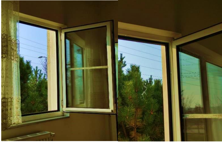
Görsel 8. A/r/tograf Kader'in sorgulama süreci

Bu alt tema içerisindeki kodlar a/r/tografların kendilerini iyi hissettikleri huzur ortamı, duydukları sevgi, diğer insanlara göre aykırılık, birbirine zıt olan görseller ve hayat telaşlarına söylemlerinden yola çıkarak ulaşılmıştır.