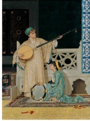
Osman Hamdi Bey- İki Müzisyen Kız- 1880