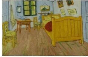
Vincent Van Gogh- The Bedroom- 1888