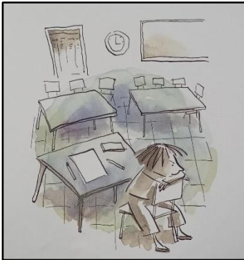
Resim 3. Çizgi öğesine ilişkin