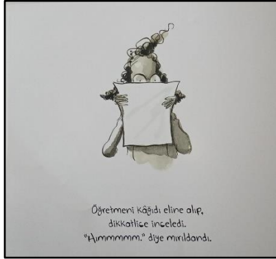
Resim 16. Valör öğesine ilişkin örnek çizim 1