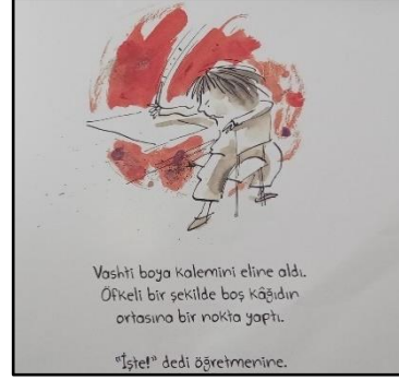
Resim 10. Renk öğesine ilişkin örnek çizim 2

Kitapta yer alan resimlerde genel olarak yeşil, gri, kahverengi, kırmızı, turuncu, sarı, mavi, mor renkler sulu boya tekniğiyle kullanılmıştır. Sözü edilen renkler genel olarak fonda yer almaktadır. Kitaptaki resimlerde kullanılan renkler, bağlı olduğu uyuma ve sanatçının o anki heyecanına bağlı olarak estetik bir yapı içinde resmedilmiştir. Ayrıca fonda seçilen bu renkler figürlerin tek ton ifadesine zıtlık oluşturarak resmin canlılığını arttırmıştır (Bkz. Resim 11). Kitaptaki görsellerin renklendirilmesinde alışılmışın dışından az renk kullanıldığı görülmektedir. Yolcu (2009, s.59)'a göre birçok renk kullanarak güzel bir resim meydana getirebileceğini sanmak bir yanılgıdır. Bir resmin çok renkli görülmesi demek, çok renk kullanılması demek değildir. Bazen çok renk, renksizlik bile oluşturabilir. Etkili bir renk uyumu için, iki-üç renk ve valörleri yeterli olabilir. Resmin her alanının aynı değerde renge sahip olması ve okurun ilgisinin sadece bir yere toplamadan sayfanın her alanını aynı anda algılaması gerekmektedir. Kullanılan renk sayısının az olması da okuru yalın bir anlatıma götürür (Aksoy, 2021; Yolcu, 2009).