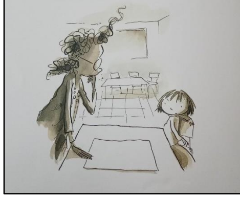
Resim 7. Boşluk (lar) öğesine ilişkin örnek çizim

yorumlanabilir. Boşlukların bu yönüyle kullanımı, kitabın yaratıcı tasarımını ön plana çıkaran noktalardan biri olarak değerlendirilebilir.