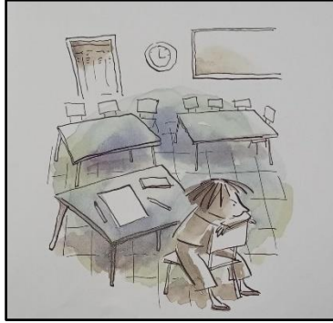
Resim 12. Renk ögesine ilişkin Örnek çizim 4

dikkat çekicidir (Bkz. Resim 12, 13, 14). Bu durum kitabın tasarımındaki en yaratıcı unsurlardan biri olarak değerlendirilebilir.