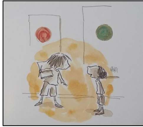
Resim 6. Şekil ögesine ilişkin örnek çizim 2