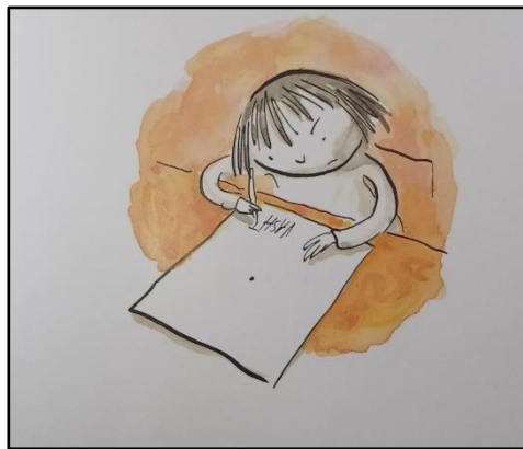
Resim 11. Renk öğesine ilişkin örnek çizim 3

İncelenen bu eserde, hâkim renk ve onun etrafında diğer renkler ya da onların tonları yer almıştır. Bazı alanlarda ise tek renk uyumu, yakın renk uyumu ve zıt renk uyumu kullanılmıştır. Bu durumun, renk ile kompozisyonu oluşturan diğer öğelerin uyumuna katkı sağlandığı söylenebilir.