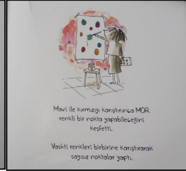
Resim 14. Renk ögesine ilişkin örnek çizim 6

Kitabın kapak resmi, incelenmeye değer bir başka yaratıcı unsur içermektedir. Detaylı incelendiğinde, kapak tasarımının turuncu ve sarının karışımında alacalı ve canlı bir görünüme sahip olduğu görülmektedir. Kitabın adıyla uyumlu bir şekilde kocaman bir nokta işareti yer almaktadır. Kitabın kahramanı elindeki kocaman bir fırçayla bu noktayı boyamaya çalışmaktadır. Kitaptaki diğer resimler göz önünde alındığında, ana karakterin çizimi henüz bitmiş değildir, yani devingenlik kitabın daha kapak tasarımından başlayarak devam etmektedir (Bkz. Resim 15).