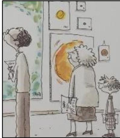
Resim 8. Doku öğesine ilişkin örnek çizim

Doku, resimde yüzeyin özelliğini duyumsatmanın yanında çizilen resme somut bir hissetme duygusu, duygusallık ve canlılık da katmaktadır (Bassa, 2019; Yolcu, 2009). Bu bağlamda kitapta hâkim olarak görülen iki boyutlu fırça lekeleri ile kalemın resim yüzeyinde bıraktığı dokular varlığını hissettirmektedir. Gezer (2019)'in de belirttiği üzere gözün algıladığı her şeyin bir dokusu olmakla beraber bu bazen net belirgin iken bazen de çok belirgin değildir. Resim 8'e bakıldığından lekeler, kalem izleri ve sağ en baştaki küçük çocuk ve yanındaki yaşlı kadının kıyafetinin betimlenmesinde dokulara yer verilmiştir. Tabi ki bu kitap dokular yoğun ve gerçekçi değil görsel bir dokudur. Genel olarak bakıldığında ise belirgin bir dokunun varlığından söz etmemiz oldukça zordur. Doku, gerçek dünyada dokunarak hissedilen şeyler temsil ederken, iki boyuta indirgenildiğinde dokunmadan algılanan şeyler haline gelir. Nitekim gözün algıladığı her şeyin dokusu olmakla beraber, bunların bazıları net görünürken bazılarıysa yeterince görünür olmayabilir (Gezer, 2019).