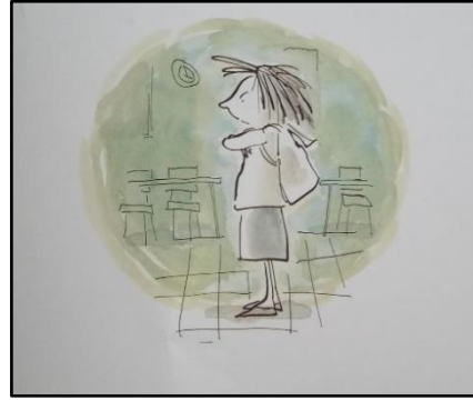
Resim 17. Valör öğesine ilişkin örnek çizim 2