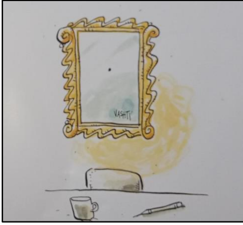
Resim 5. Şekil ögesine ilişkin örnek çizim 1

Kitapta hem organik hem de geometrik şekillere yer verildiği görülmektedir. Organik şekiller, doğal dünyaya dair insan, hayvan, bitki gibi formları (Bkz. Resim 6) ifade etmektedir. Buna ek olarak geometrik şekiller (Bkz. Resim 5) ise kare, üçgen, dikdörtgen gibi doğal olmayan ve insan yapımı nesnelere içermektedir. Kâğıtlar, masa, sandalye ve sulu boya bu duruma örnek verilebilir. Kitabın her sayfasında her iki şekil türüne de rastlamak mümkündür. Ayrıca nokta her sayfada yer alan resimlerde bazen fon olarak bazen de bir şekil olarak varlığını hissettirmektedir. Şekiller çeşitli özellikleri barındırmasına rağmen Resim 6'da da görüldüğü gibi sadece renklerden de oluşabilmektedir. Üzerinde durulması gereken bir diğer özellik ise daha çok yazı dilinde karşımıza çıkan ve küçük boyutlu nokta, bu kitapta büyük bir şekilde çizilmiştir. Bu yorumlama yazarın yaratıcılığı ve ana iletiyi sunma biçimiyle ilgili olabilir. Kitabın adı ve kapaktaki çizimlerin yanı sıra sayfalar ilerledikçe oluşturulan resimlerin de aynı yaratıcılık ve özenle tasarlanması, çocuğun anlam evrenine uygunluğunu ve kitabın kolay anlaşılabilirliğini sağlamaktadır (Basa, 2019; Özsoy ve Ayaydın, 2016).