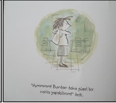
Resim 13. Renk ögesine ilişkin örnek çizim 5