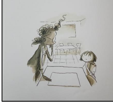
Resim 9. Renk öğesine ilişkin örnek çizim 1

duyguları kolaylıkla algılayabilmekteyiz. Kitapta genel olarak renklerin, karakterin duygu durumuna uygun şekilde renklendirildiği söylenebilir.