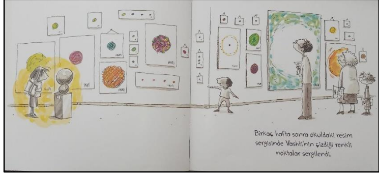
Resim 2. Kompozisyon öğesine ilişkin örnek çizim 2