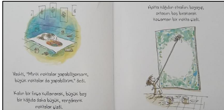
Resim 4. Çizgi öğesine ilişkin örnek çizim 2