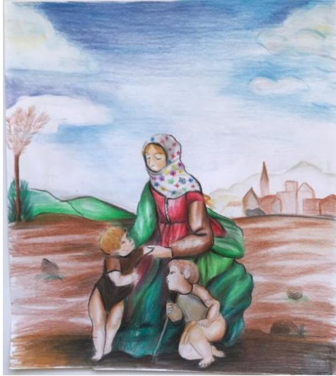
Resim 13. Öğrenci Yusuf'un Çalışması

Öğrencinin Raffaello Sanzio'nun "Güzel Bahçıvan Kız" adlı sanat eserini yorumladığı görülmektedir. Öğrenci yorumladığı eser için aşağıdaki açıklamalarda bulunmuştur;