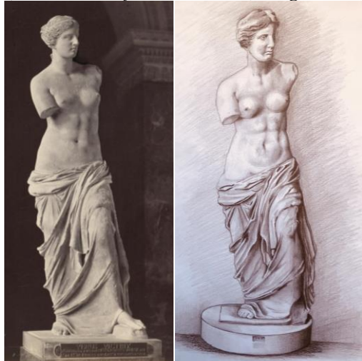
Resim 8. “Milo Venüsü (Alexandros of Antioch,1820)”, öğrenci Zeynep'in desen çalışması

Öğrencinin çizimine bakıldığında Antik Yunan Heykel sanatının en ünlü örneklerinden biri olan Alexandros of Antioch tarafından 1820 yılında yapılan “Milo Venüsü”nün çalışıldığı görülmektedir. Bu eserdeki figür bir aşk tanrıçasıdır. Esere baktığımızda ayakta ve iki kolu olmayan, bir ayağı öne doğru diğeri de geri biçimde konumlanmış bir kadın figürü görülmektedir. Belden aşağısının bir örtüyle sarılı olmasına karşın belden yukarısının çıplak olması dikkat çekmektedir. Öğrencinin çizgi ve iyi bir ışık-gölge kullanımı, üç boyutlu çalışmanın iki boyuta çevrilmesine rağmen heykel formunu koruduğunu göstermektedir.