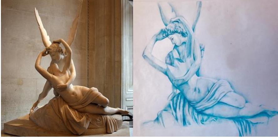
Resim 5. “Cupid’in Öpücüsü (Antonio Canova,1822)”, öğrenci Fatma’nın desen çalışması

Öğrencinin çizimine bakıldığında Antonio Canova’nın 1822 yılında yaptığı Cupid’in Öpücüsü adlı eserini mavi renkte çalıştığı görülmektedir. İki figürden oluşan bu eseri incelediğimizde doğru oran ve orantı ile yerleştirdiğini, çizgilerin de yumuşak bir formda olduğu görülmektedir. Öğrenci eseri çalışırken mavi kuru boya kalemi tercih ettiği, ışık-gölgeyi etkili bir biçimde kullandığı görülmektedir.